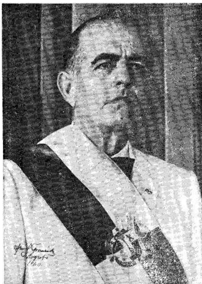
Excelentísimo Señor Presidente Don ROBERTO F. CHIARI.