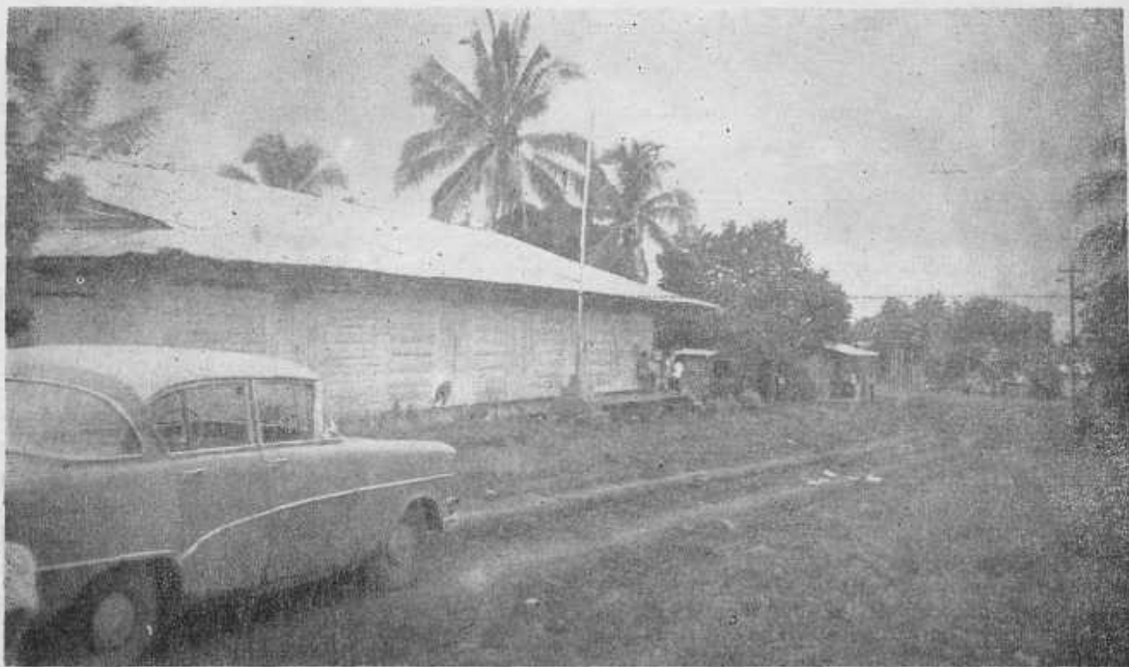
En primer plano la Escuela, que está pidiendo a gritos un edificio nuevo. Al fondo parte del poblado de Gariché.