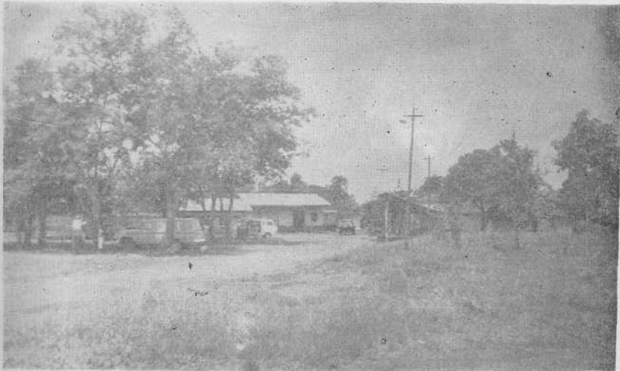
Vista parcial de Aserrió cabecera del Corregimiento de Gariché, lugar que hoy ha cobrado importancia por ser terminal de los transportes de pasajeros que esperan el tren del ferrocarril Aserrió-Barú. La antigua primacía que tenía la Estación en La Concepción la tiene hoy Aserrió con motivo de la apertura de la Carretera Interamericana.

Santo Domingo formaba parte del Corregimiento de Góngora, pero por medio del Acuerdo Municipal No. 27 del 22 de Diciembre de 1932 fue separado de aquel y pasó a la categoría de Corregimiento con el nombre que actualmente lleva. También es un poblado situado a orillas de la vía férrea que va a Puerto Armuelles y poco trecho distante de la carretera Interamericana. No menos luchadores que los de Santa Marta, sus moradores mantienen en alto la bandera del progreso y su futuro es halagador hoy que le pasa la Carretera hacia Divalá y lo comunica con las fértiles tierras de Manchuila, Divalá y Orilla del Río. Su proximidad a Santa Marta promueve una competencia que es como un acicate para su superación.